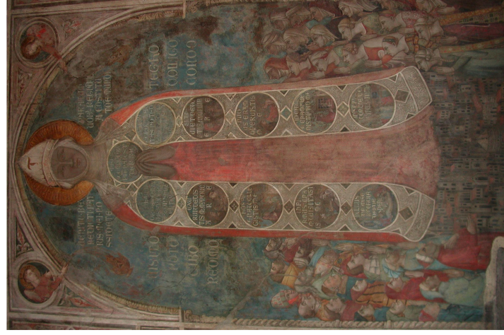
La Madonna della Misericordia Compagnia del Bigello - Firenze

“Ecco la consegna che vi affido: siate i promotori e fautori della Civiltà dell’Amore, siate testimoni infaticabili della cultura della Carità” - Giovanni Paolo II alle Misericordie -